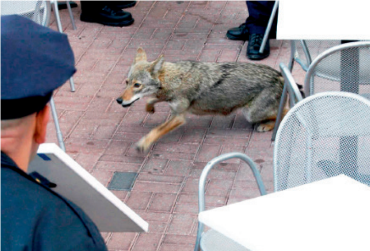
ന്യൂയോർക്ക് നഗരത്തിലെ കൊയോട്ടുകളിലൊന്ന്

കൂട്ടുറുവൻ, മരപ്പട്ടി, മഞ്ഞക്കിളി (oriole) തുടങ്ങിയ ചില വർഗ്ഗങ്ങൾ തിരശ്ശീലയ്ക്ക് പിറകിലേക്ക് പതുക്കെ നീങ്ങുന്നുണ്ട്. വർധിച്ചുവരുന്ന നഗരവത്കരണത്തിന്റെ ഫലമായി കൂടുതൽ കൂടുതൽ വർഗ്ഗങ്ങൾ നഗരങ്ങളിലേക്ക് കടന്നുകയറാൻ നിർബന്ധിതരാകുന്നുണ്ട്. സ്വന്തം ആവാസവ്യവസ്ഥകൾ നശിച്ചതോടെ അമേരിക്കയുടെ വിജനഭൂമികളിൽ വിഹരിച്ചിരുന്ന കൊയോട്ടുകൾ (coyote) ന്യൂയോർക്ക് നഗരമധ്യത്തിലും പാർപ്പുറപ്പിച്ച് തുടങ്ങിയിരി